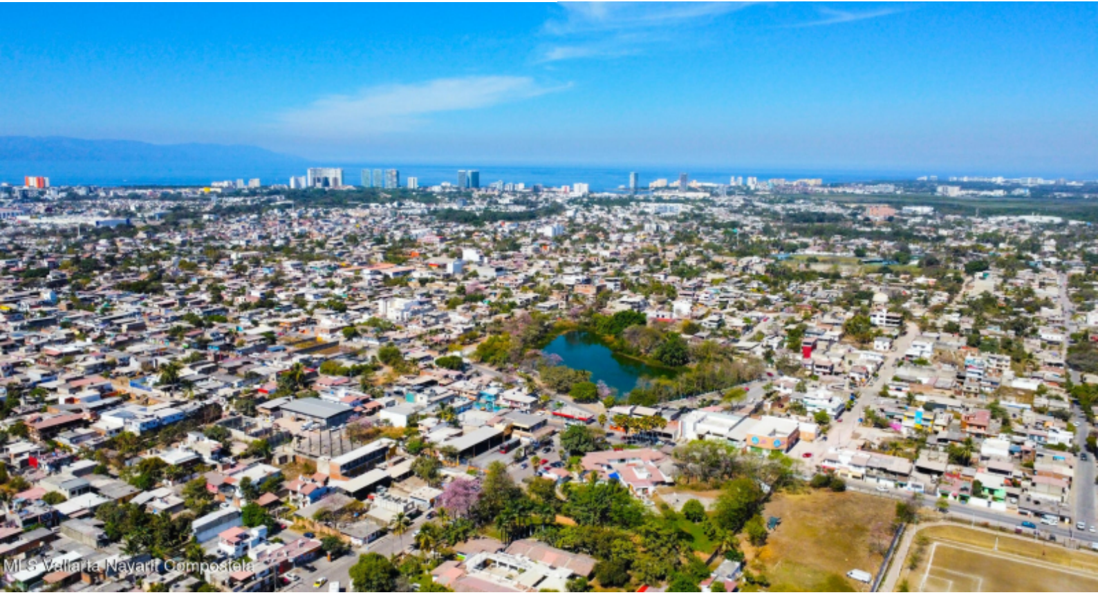
Mi S Vallarta Navarr Compostela