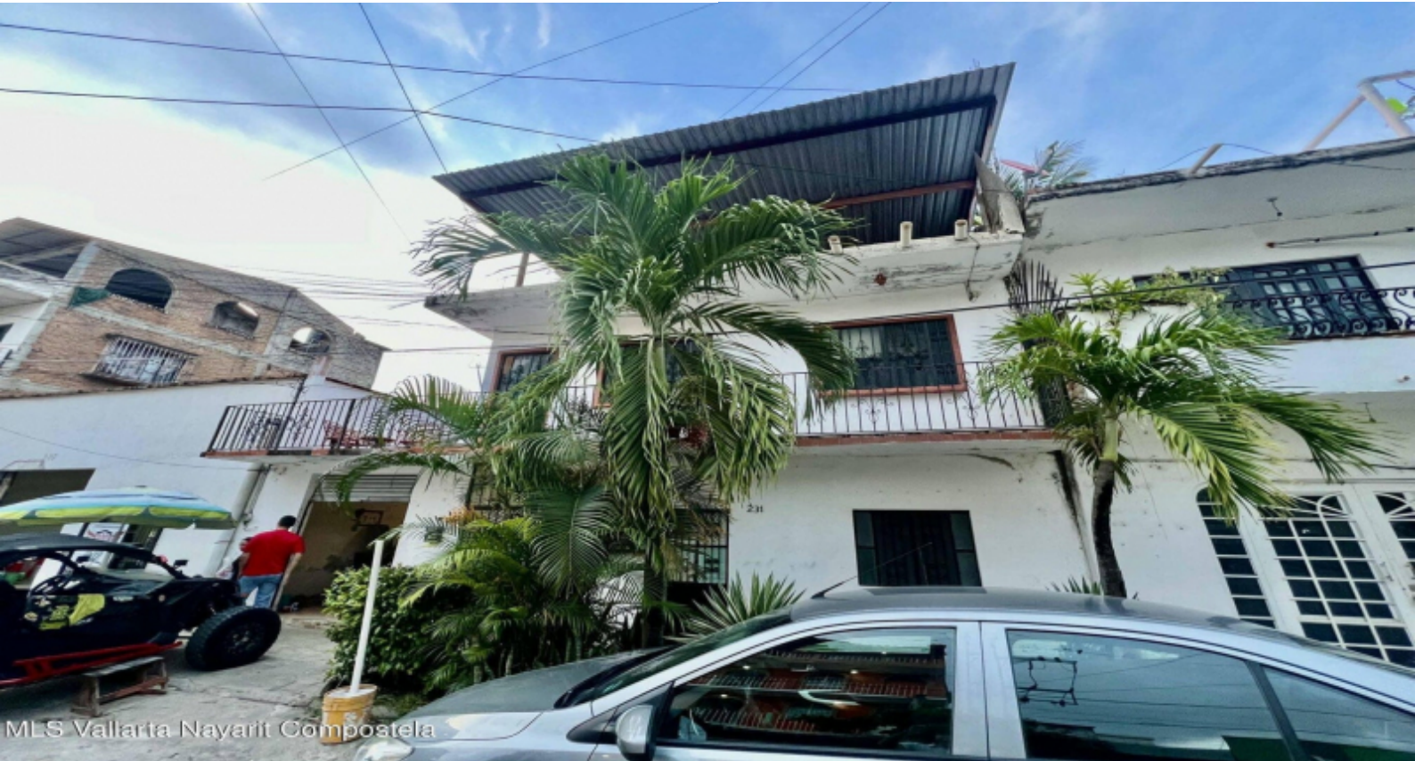
MLS Vallarta Nayarit Compoatela